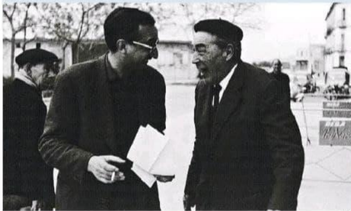
Joan Fuster-Josep Pla

El 1978 va patir un atemptat terrorista de la ultradreta, i el 1981 un altre amb una bomba que gairebé el mata i que va destrossar la façana del seu habitatge. No es va detenir ni es va interrogar mai ningú. Aquell atemptat va animar l'assagista a deixar de banda l'activisme polític i dedicar-se només a la literatura, aïllant-se a la seva casa de Sueca. El 1985 es va doctorar a la Universitat de València i el 1986 va aconseguir la càtedra de Literatura. Un any abans de morir va trencar el silenci amb una entrevista a La Vanguardia . La seva casa de Sueca s'ha convertit en museu.