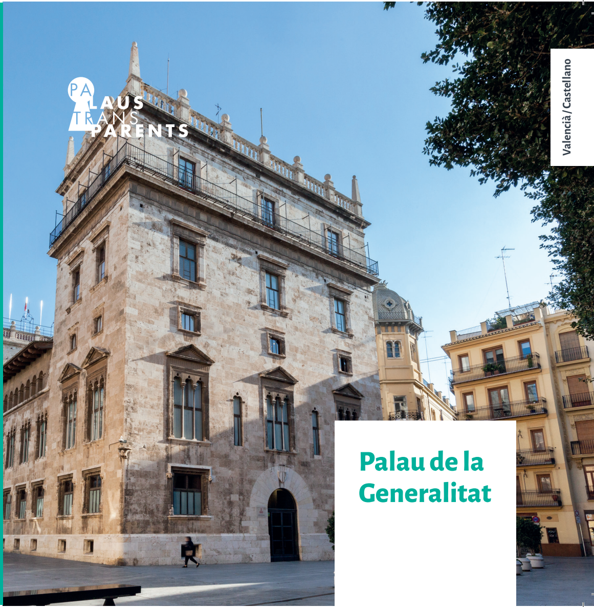
Palau de la Generalitat