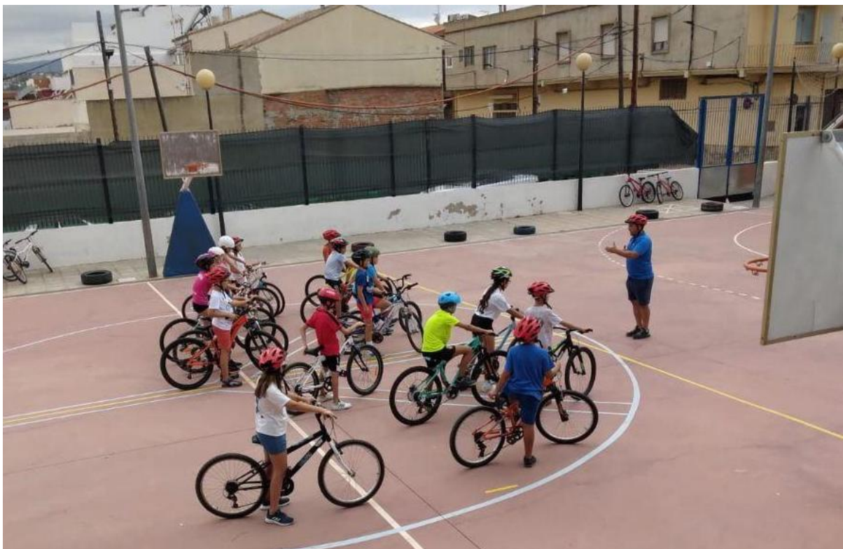
Imatge: durant el desenvolupament del taller d'aprenentatge i maneig de la bicicleta, s'ensenyen habilitats bàsiques i avançades per a utilitzar amb seguretat la bicicleta.

Les activitats en les quals s'utilitza la bicicleta es realitzen fent ús, per part de tot l'alumnat, del casc, ja que el seu ús és obligatori. En les activitats externes al centre docent, l'alumnat es fa visible mitjançant jupetins reflectors.