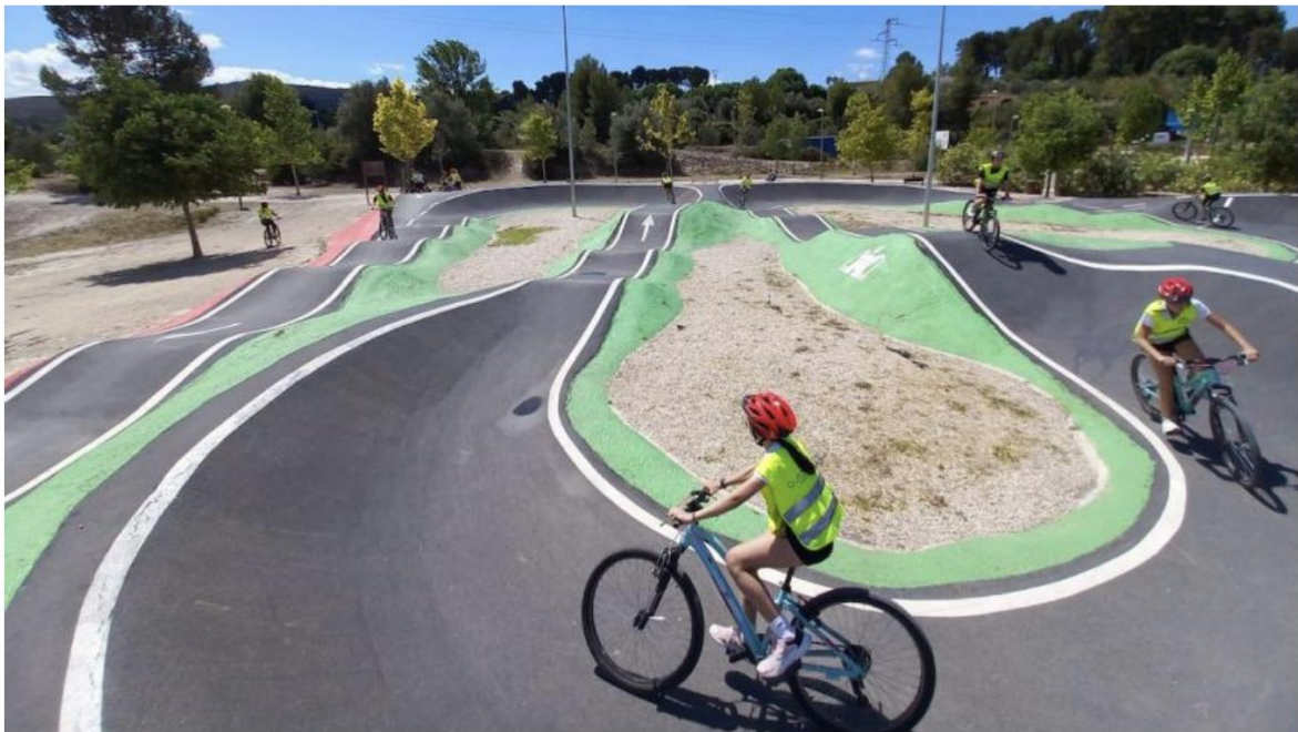
Alumnado del IES L'Estació experimentando el firme peraltado en el Pumptrack del Ajuntament d'Ontinyent

La 5ª Edición del proyecto Aula Ciclista promocioa el ciclismo en edad escolar: un deporte inclusivo, sostenible, saludable y divertido.