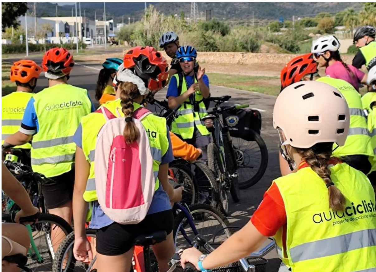
Imatge: últimes instruccions del personal del projecte a l'alumnat del centre docent, abans de començar l'itinerari urbà pels carrers de la localitat.

D'altra banda, amb el grup més nombrós, que el solen constituir els que saben circular amb bici, es fan progressions que inclouen frenades segures, girs i frenades brusques, pujades i baixades de vorades i voreres, rodatge en parelles i en filera, habilitats d'equilibri, rodatge en doble sentit utilitzant l'espai disponible en carrils bici convencionals, circulació en paral·lel, senyalitzacions amb una mà, conducció regulada per balises, etc.