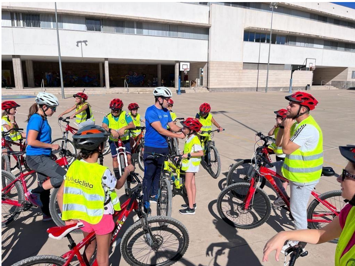
Imatge: prolegòmens previs a l'inici de l'itinerari urbà. Tot l'alumnat es prepara i és revisat per part del personal tècnic del projecte.

Les activitats en les quals s'utilitza la bicicleta es realitzen fent ús, per part de tot l'alumnat, del casc, ja que el seu ús és obligatori. En les activitats externes al centre docent, l'alumnat es fa visible mitjançant jupetins reflectors.