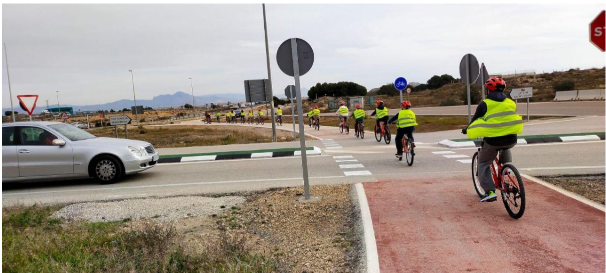
Imatge: l'alumnat dels centres aprèn a circular per les vies més segures, i a prendre les decisions que fan del maneig de la bicicleta una experiència divertida i senzilla.