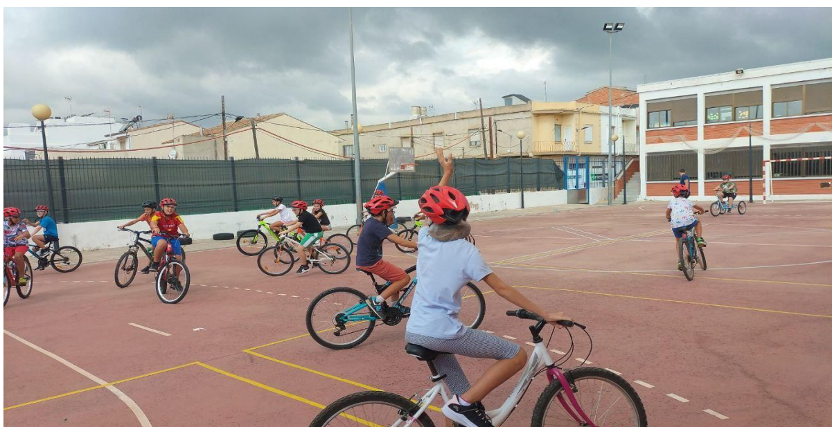
Imatge: taller de maneig de la bicicleta en les instal·lacions del centre docent, un escenari idoni per a l'ensenyament d'habilitats en l'ús de la bicicleta, així com per a aprendre a anar amb bicicleta.