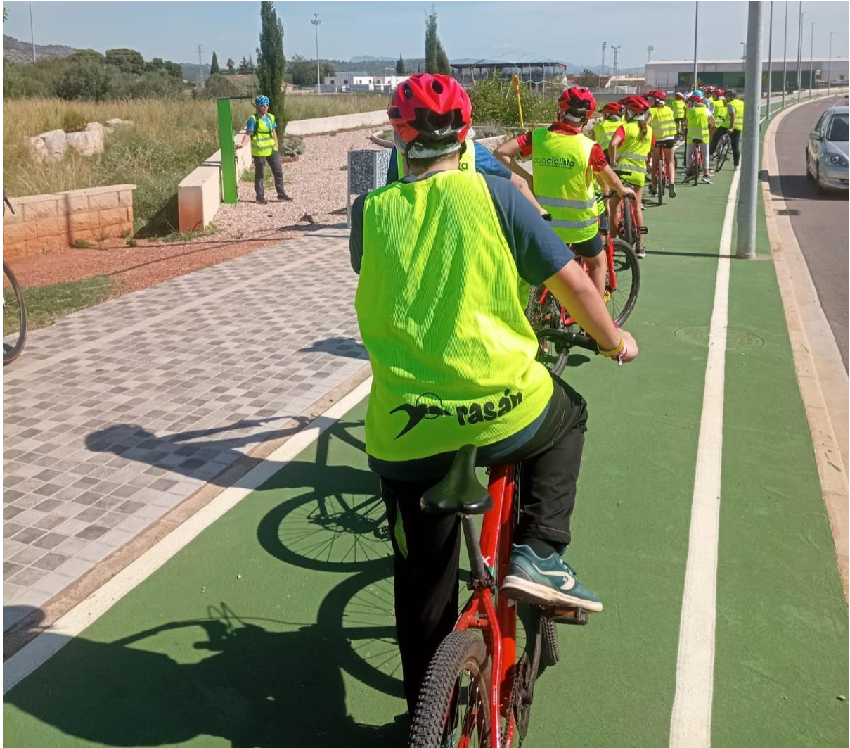
Imatge: instant en el qual un grup d'alumnes deté l'itinerari per a atendre les indicacions del personal tècnic del projecte, sobre un lloc d'accessoris per a la posada a punt de les bicicletes.