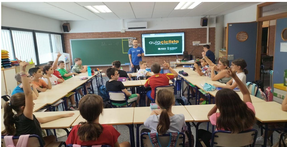
Imatge: interacció entre alumnat i personal del projecte durant la sessió de sensibilització, que es realitza en l'aula.

D'altra banda, amb el grup més nombrós que el solen constituir els que saben circular amb bici, es fan progressions que inclouen frenades segures, girs i frenades brusques, pujades i baixades de vorades i voreres, rodatge en parelles i en filera, habilitats d'equilibri, rodatge en doble sentit utilitzant l'espai disponible en carrils bici convencionals, circulació en paral·lel, senyalitzacions amb una mà, conducció regulada per balises, etc.