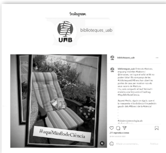
Figura 2. Entre els racons de lectura dels que formem la BCT triomfen els balcons i terrasses.

En relació amb el primer punt, s'han comptabilitzat 484 usuaris que han consultat el web d' Inflat de Ciència! , on destaquen els 88 que