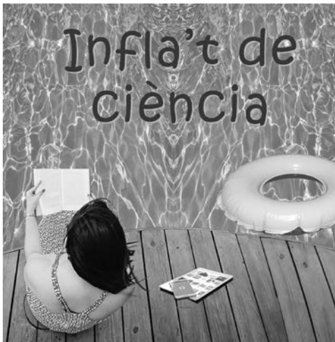
Figura 1. Imatge oficial de la campanya engegada a l'estiu del 2020 per la Biblioteca de Ciència i Tecnologia.

Tot a través de l'entorn conegut de Ciència per llegir , amb l'objectiu d'informar, entretenir i formar. I sota el nom comú d' Infla't de Ciència! , denominació que convida a l'acció, a exclamar la llibertat del mateix usuari/lector a respirar el seu temps de lleure, i si és amb ciència, millor. La ciència, el nostre senyal d'identitat, la clau de volta entorn de la qual giren totes les activitats promogudes per la BCT. Una ciència en format vacances, però igual de rigorosa.