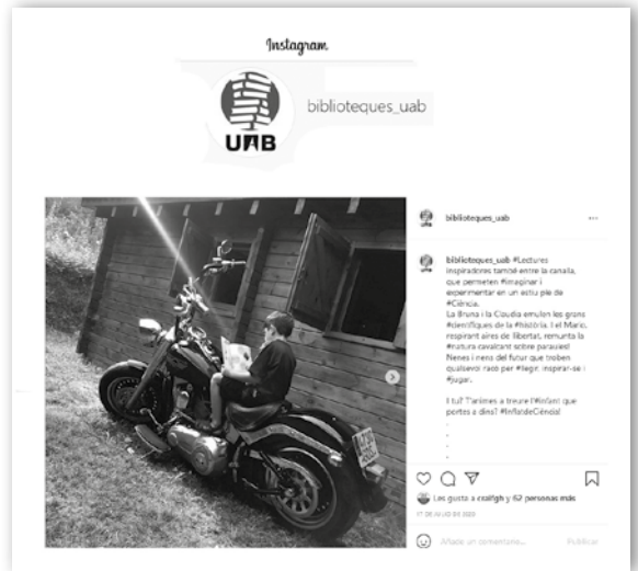
Figura 3. Posant l'accent en els hàbits lúdics i lectors de nens i nenes, es pretén captar l'atenció dels pares per incentivar les activitats en família.